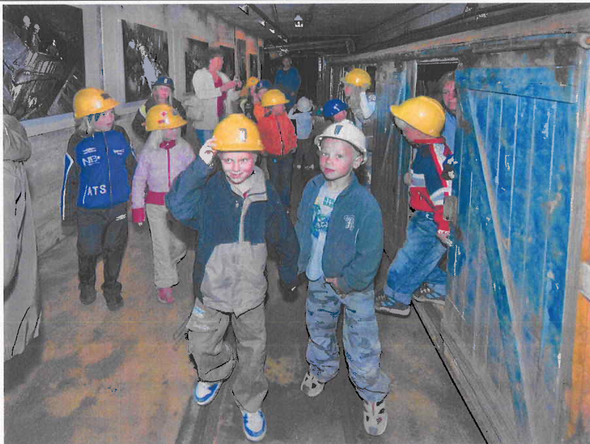
"Med ungene i gruva"