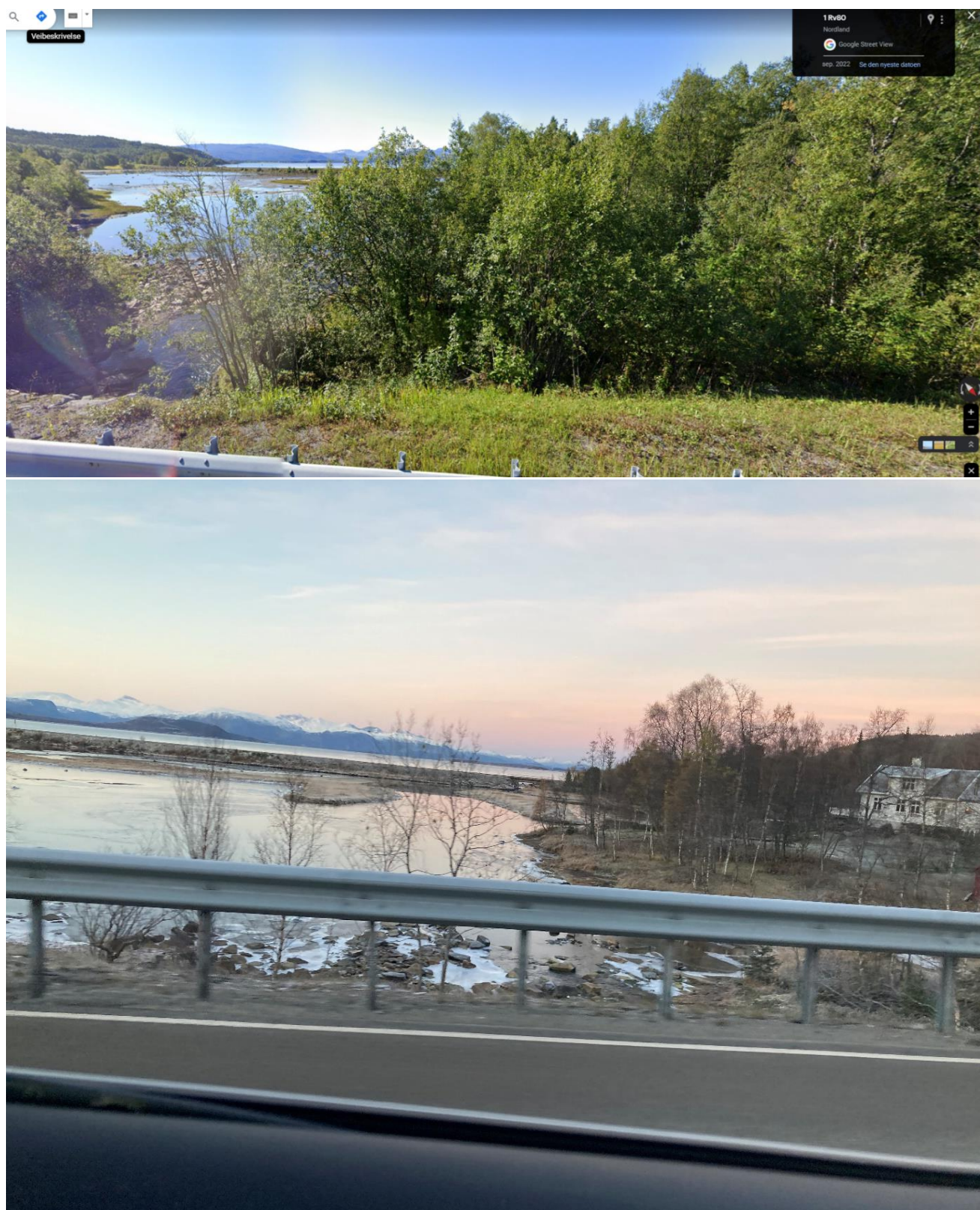
Figur 9: Nordviksvingen før og etter, sett mot vest.