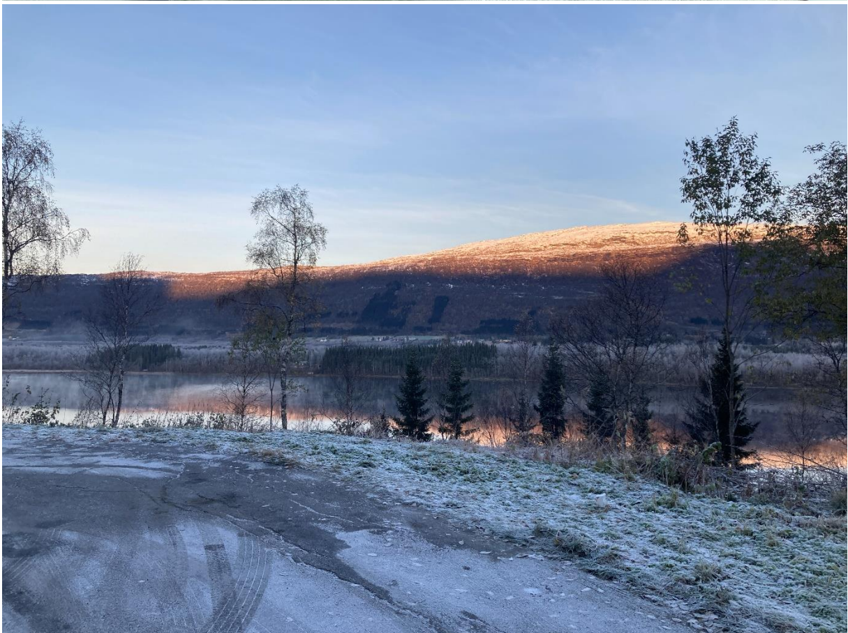
Figur 11: Før og etter Vallvatn, mot vest.