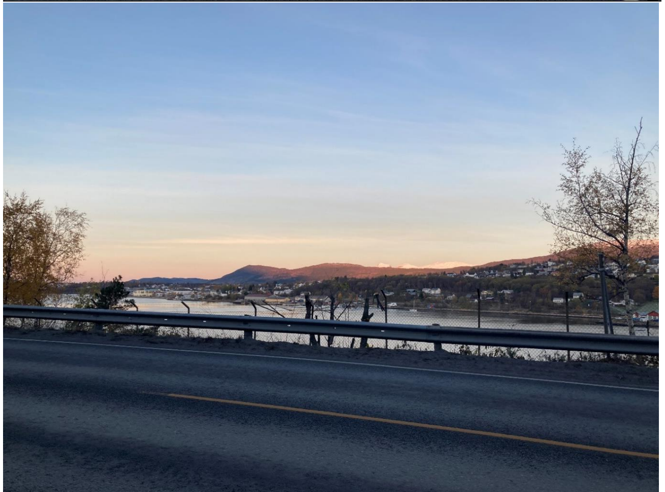
Figur 5: Kleiva før og etter 2.