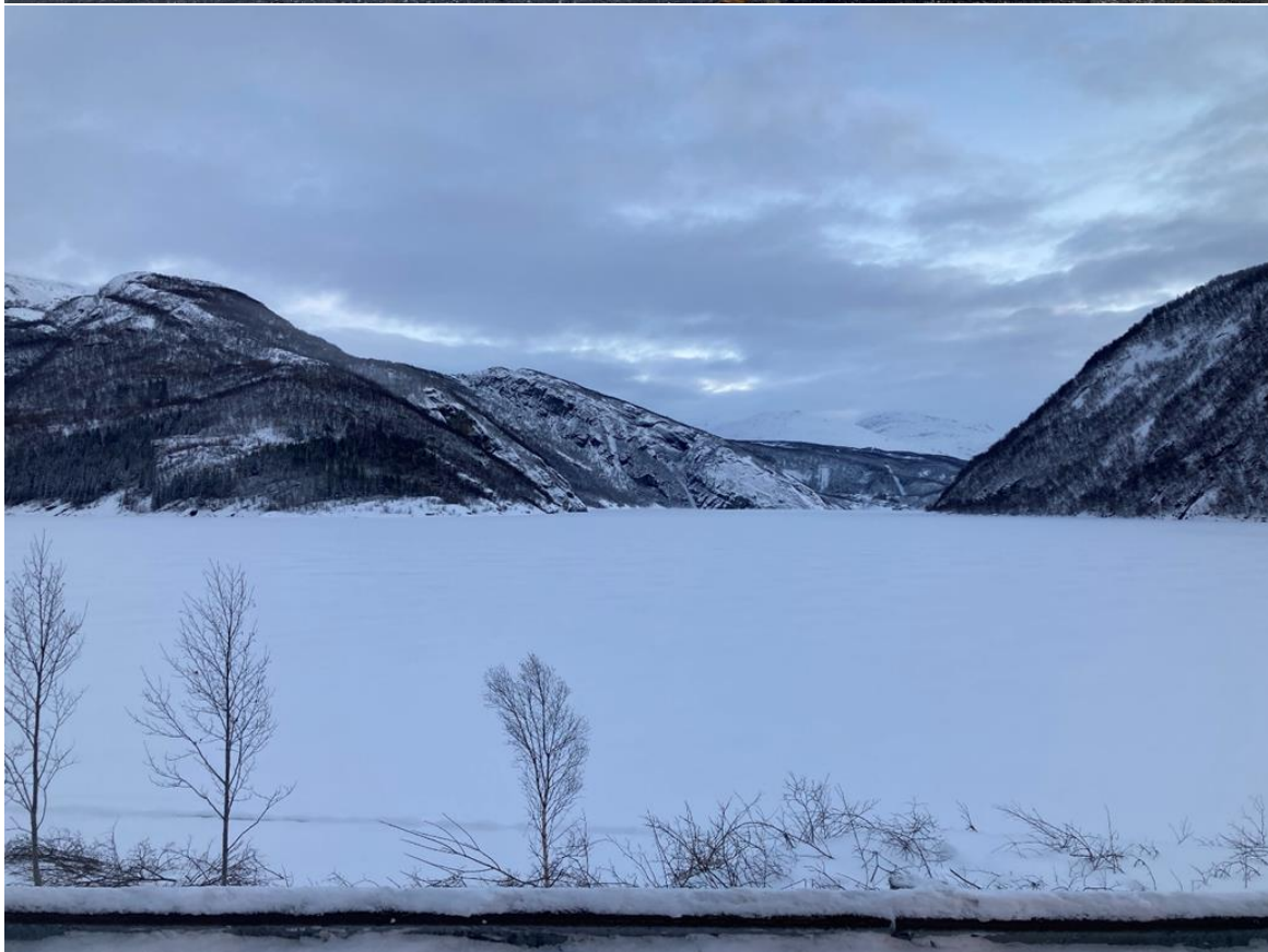
Figur 14: Før og etter Movika, sett mot øst.