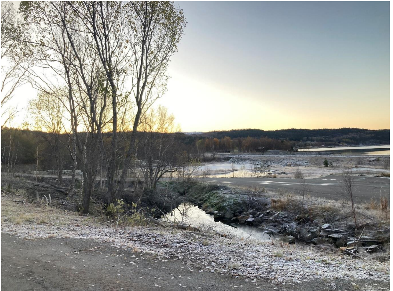
Figur 8: Nordvik før og etter, sett mot sør-øst.