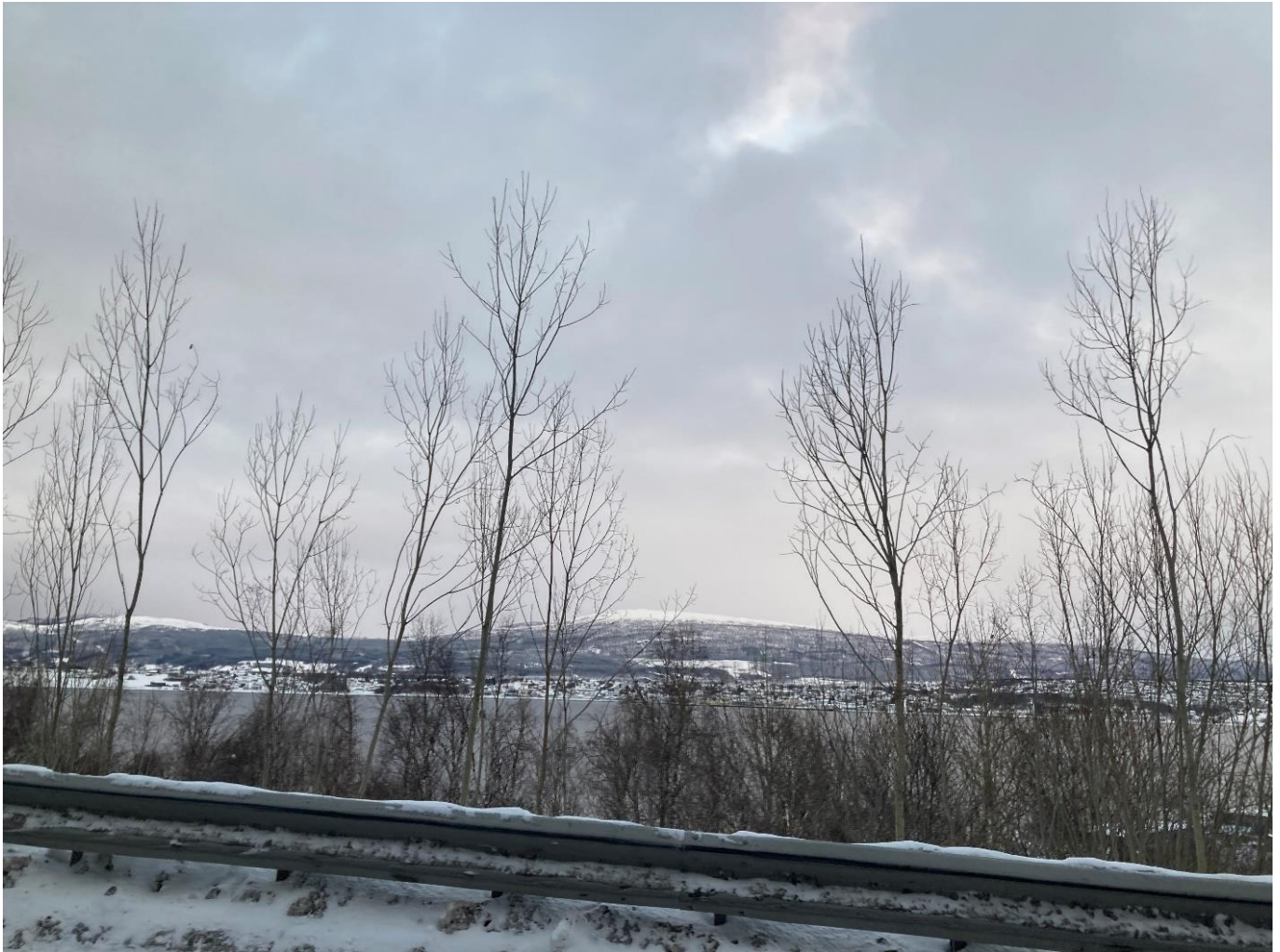
Figur 13: Sysselvik før og etter.