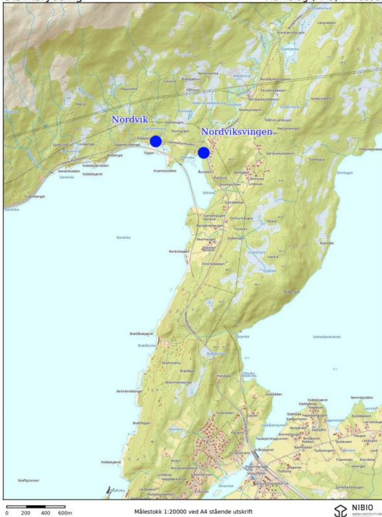
Figur 2: Rydding Valnesfjord/Nordvik.