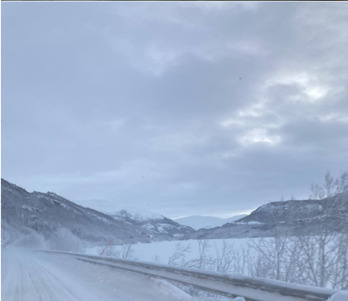
Figur 16: Langvatn før og etter.