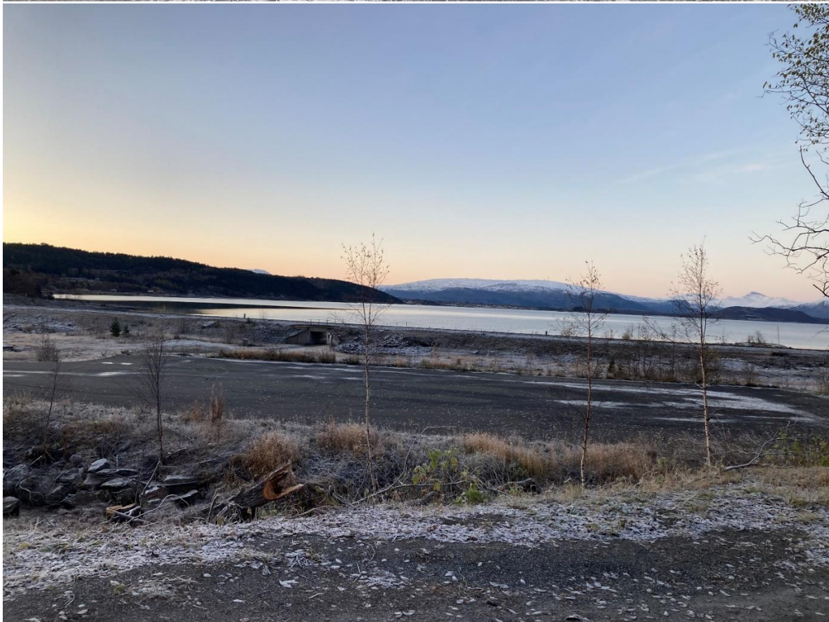
Figur 7: Nordvik før, sett mot sør.