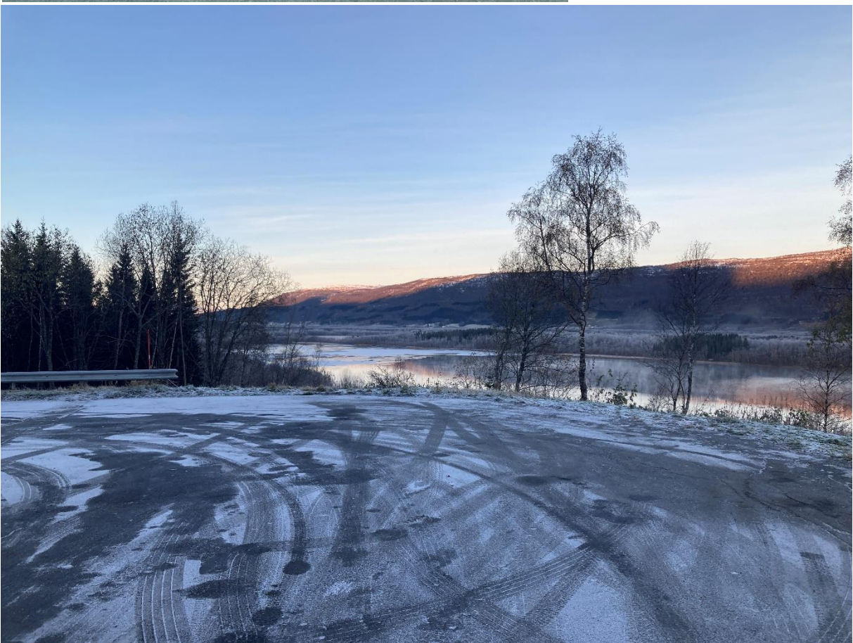
Figur 10: Før og etter Vallvatn, mot sør.