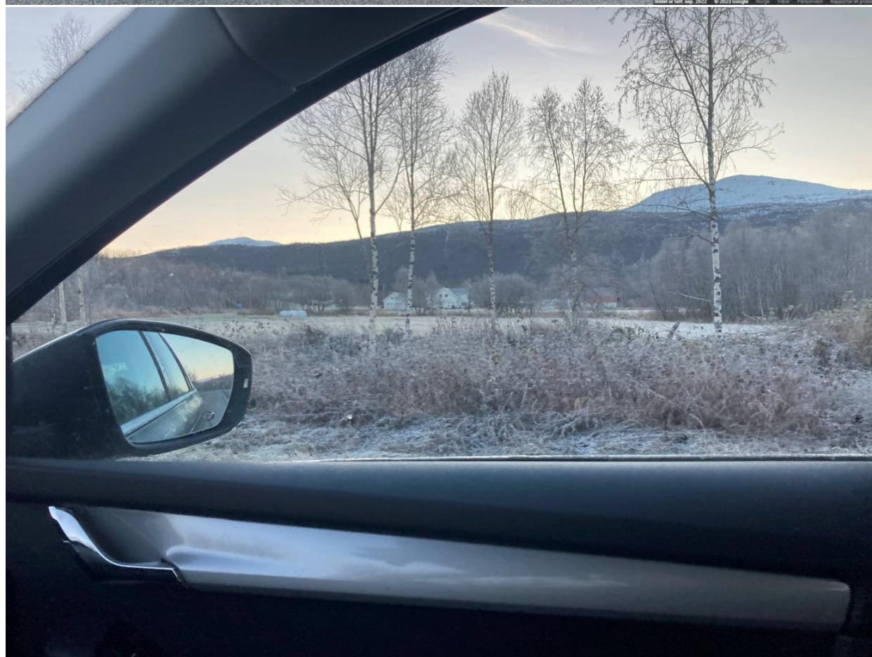
Figur 12: Grønnåskrysset før og etter, sett mot øst.