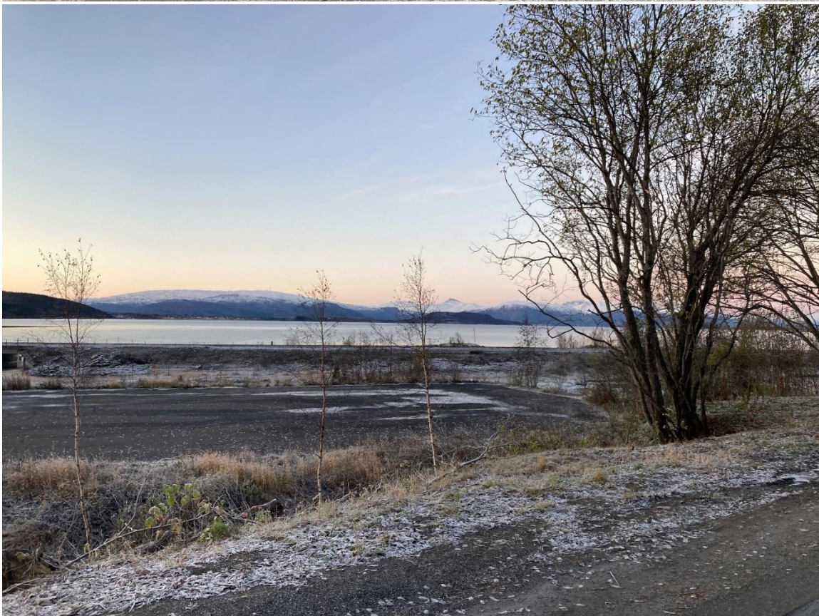
Figur 6: Nordvik før og etter, sett mot sør-vest.