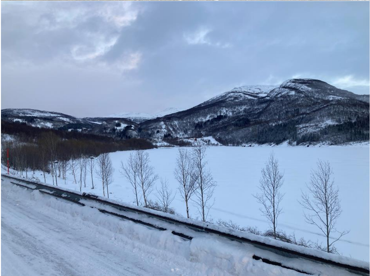
Figur 15: Før og etter Movika, sett mot nord-øst.