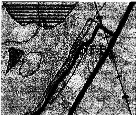
Figur 1. Etter Fylkesmannens vurdering bør inngrep i kalkfuruskogen unngås. Det fremmes derfor innsigelse til området skravert rødt.

Den fuktige kalkfuruskogen utgjør en suppleringslokalitet til de større og mer sammenhengende kalkfuruskogene. Tilsvarende fuktig utforming er lite representert i Salten, og lokaliteten som helhet er verneverdig. Følgelig må avgrensingen av LNF-B6 justeres, slik at inngrep i kalkfuruskogen unngås, jfr. figur 1. Det vises i denne sammenheng til § 4 i Lov av 19.06.09 om forvaltning av naturens mangfold, hvor det påpekes at mangfoldet av naturtyper skal ivaretas innenfor deres naturlige utbredelsesområde og med det artsmangfoldet og de økologiske prosessene som kjennetegner den enkelte naturtype. Målet er også at økosystemers funksjoner, struktur og produktivitet ivaretas så langt det anses rimelig.