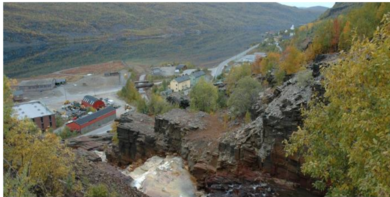
Utslipp av gruvevann fra Nordgruvefeltet til Giken.