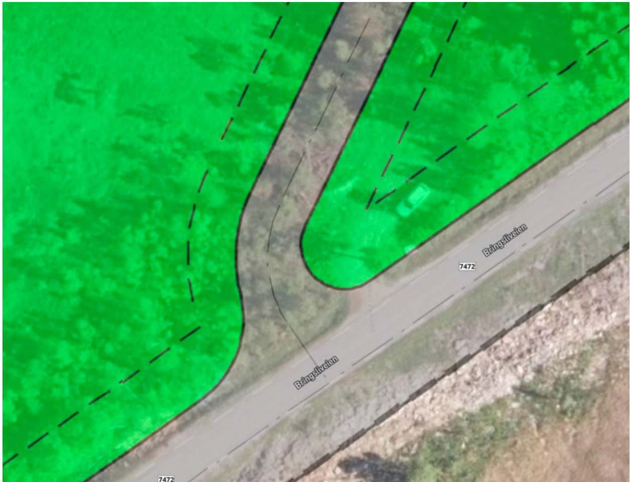
Figur 2. Utsnitt fra gjeldene plan for Kvalhornet alpinanlegg. I bakgrunnen vises parkering nordøst for regulert avkjørsel.

For å kunne oppgradere og legge til rette for en bedre parkeringsløsning er det laget et forslag til utvidelse av parkering som vist i figur 3. Planforslaget innehar kun teknisk infrastruktur.