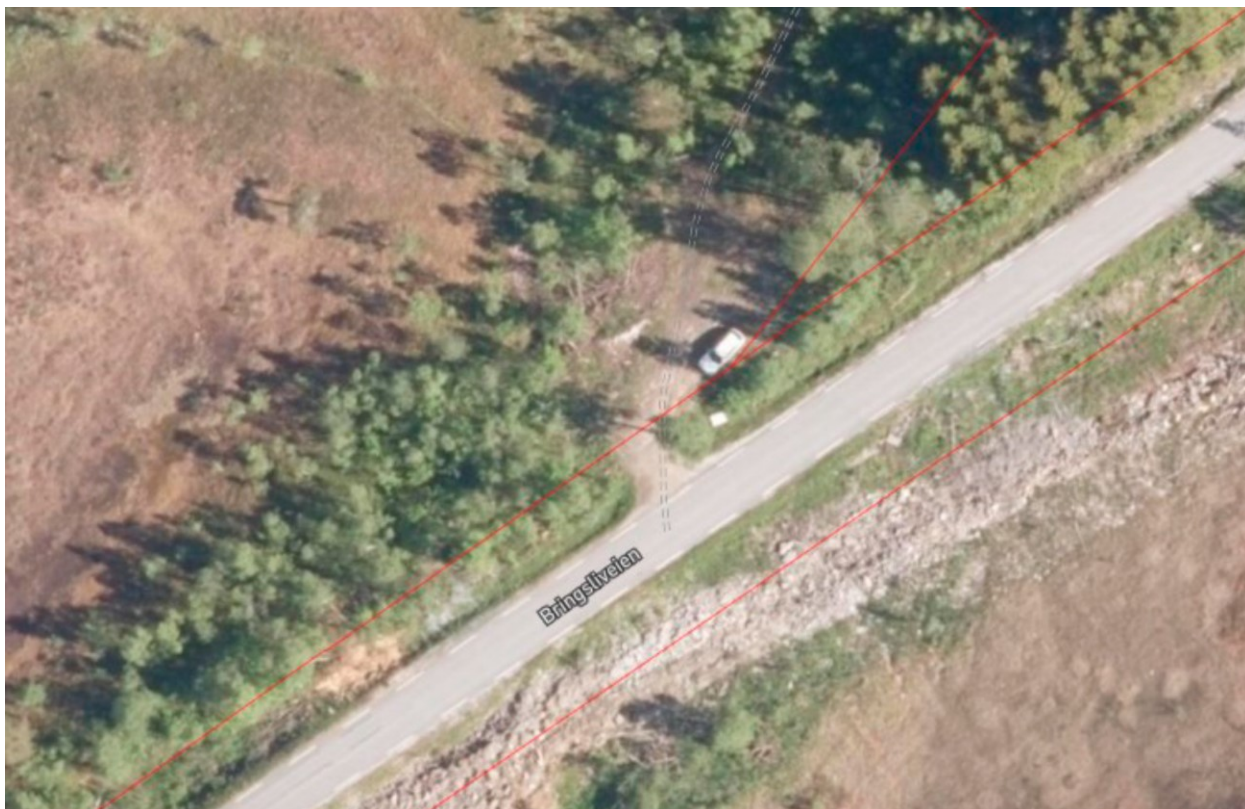
Figur 1. Oversikt over eksisterende parkeringsplass ved FV 7472 (Bringsliveien)

Kvalhornet er et populært turområde noe som resulterer i utfordringer i forhold til parkering. På grunn av kapasitetsmangel på den eksisterende parkeringsplassen blir det ofte parkert langs fylkesveien. Fartsgrensen på stedet er 80 km/t og særlig på vinteren er dette et trafiksikkerhetsproblem med tanke på redusert vegbredde og siktforhold.