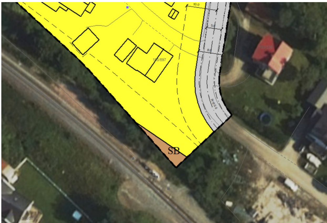
Figur 1. Utsnitt fra planforslag. SB indikerer areal til jernbaneformål som opprinnelig er avsatt til boligformål.