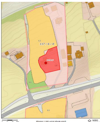
Figur 4: Innvilget tomt

Med hjemmel i plan- og bygningsloven § 20-1 gis det tillatelse til fradeling av tomt på ca. 1500 m 2 jf. figur 4 rundt eksisterende hus med adresse Skjerstadjordveien 26 fra gnr. 117 bnr. 6 på Klungset, Fauske kommune.