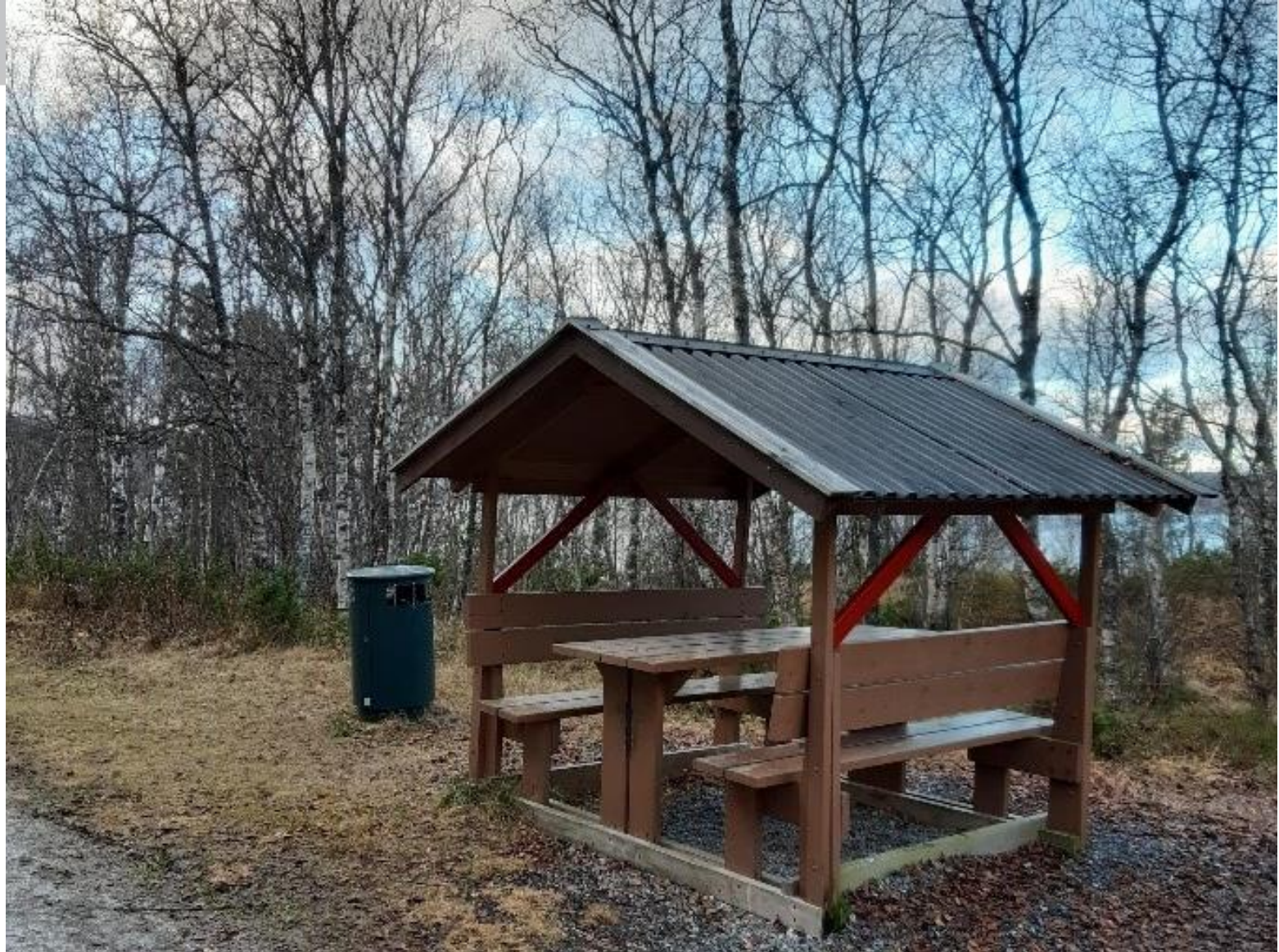
Lund-stranda, benk langs sti i skogen