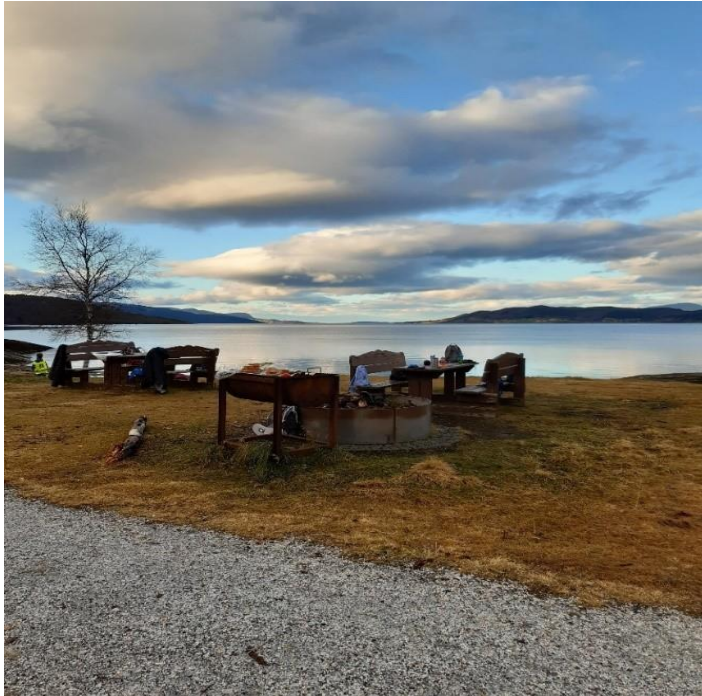
Lund, benker og grill på bade plass