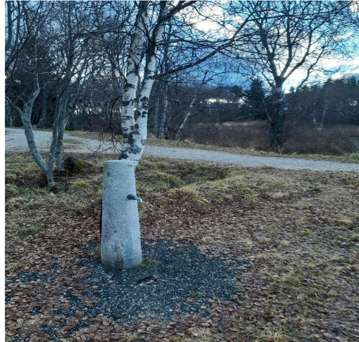
Lund, vannkran, dårlig tilkomst